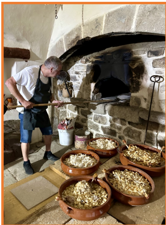
Les cassoulets ont gratiné dans le vieux four du château.

Samedi 20 septembre, le château du Pradel s'est animé aux accents toulousains.